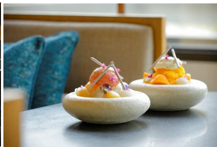
夏 麓 氷 2 種