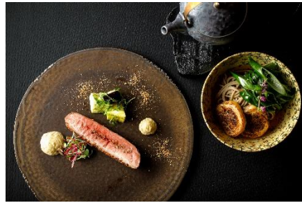
(左)七谷鴨 水茄子 サルミソース (右)鴨南蛮