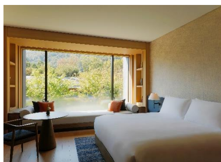
客室 デラックスルーム