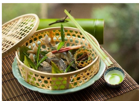
涼風鈴音 お料理イメージ