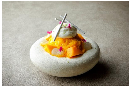
夏 麓 氷 芒果 4,048 円

上品な甘さの赤桃エスプーマ、爽やかなエストラゴンのパルフェグラスに、口どけのよいヨーグルトシェイプアイスを組み合わせたパフェ氷。果汁滴る白桃の果肉やゼリー、レモングラスの自家製わらび餅をトッピングした夏のデザートです。ヨーグルトシェイプアイスのまろやかな酸味と白桃の清々しい甘みのハーモニーをお楽しみください。