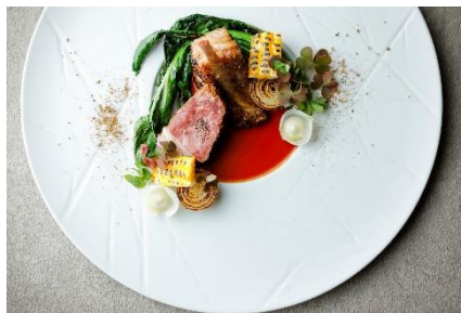
仔羊 夏野菜 スペアリブ風