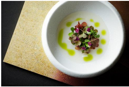
GYOZA ～ラビオリ・イノシシ・米～