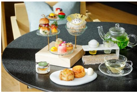
スマートロピカルアフタヌーンティー

瑞々しい旬の果物を使用したスマートロピカルアフタヌーンティーの提供 白桃とマンゴー、2種のフレーバーで仕立てるパフェ氷の販売 京都の夏の風物詩・納涼床での京会席ランチが付いた宿泊パッケージの販売