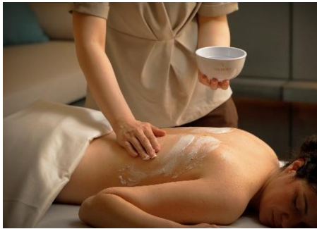
ヴァルモン ボディスクラブ

紫外線により肌のバリア機能が低下する夏の季節、肌に栄養を与えながら角質を取り除くスクラブケアと代謝を活性化させるボディトリートメントを組み合わせたスパパッケージ「ヴァルモン ボディスクラブ&トリートメント」を販売いたします。スイスの自然と先進科学を取り入れたコスメティックブランド・ヴァルモンのスクラブで、デコルテから足のつま先まで全身を隈なく磨き上げていきます。ヴァルモンのスクラブは粒子が細かく滑らかなテクスチャーで肌当たりも柔らかいため、様々な肌タイプに適しています。スクラブで毛穴の汚れや古い角質を取り除いた後は、ROKU KYOTO だけでお楽しみいただけるヴァルモンオリジナルボディトリートメント「ヴァイタリティ オブ ザ ボディ by ROKU」で疲れた身体を解き放ち、更には全身のパワーが漲るような活力アップの感覚をお楽しみいただけます。長いストロークでゆったりと全身をほぐしていくエフルラージュの手法と、ヴァルモン独自のバタフライムーブメントの両方を取り入れることで、肌に活力を与えるとともに神経の緊張を緩和させ、五感を解き覚ますリラクセスした状態へと導きます。雄大な鷹峯の自然に包まれた THE ROKU SPA ならではのトリートメント体験を通じ、この夏を生き生きと輝く素肌でお過ごしください。