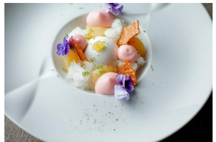
白桃 生姜 トンカ豆