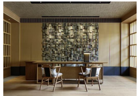
スパ レセプション