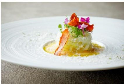
アオリイカ カルボナーラ