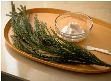
ヴァルモン ボディスクラブ商材 イメージ