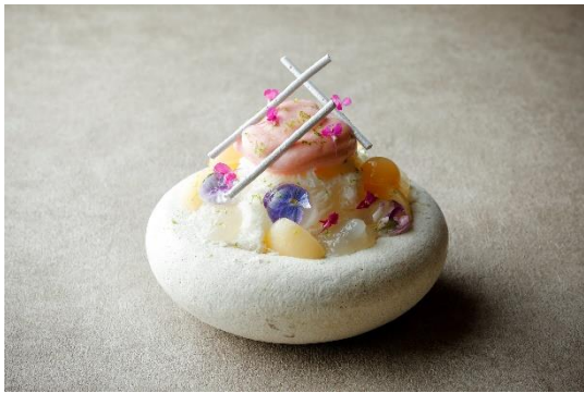
夏 麓 氷 白桃 4,048 円

パフェとシェイプアイスを掛け合わせたハイブリットなかき氷「夏 麓 氷」が今年も夏季限定で登場いたします。フレッシュマンゴーを贅沢にあしらった杏仁とココナッツが香るトロピカルな「夏 麓 氷 芒果」の定番パフェ氷に加え、今年は白桃フレーバー「夏 麓 氷 白桃」が新たに登場。相性の良い白桃エスプーマとヨーグルトシェイプアイスを組み合わせた桃尽くしの一品です。口溶けなめらかなシェイプアイスを使用したボリューム感たっぷりの夏季限定メニューをご賞味ください。