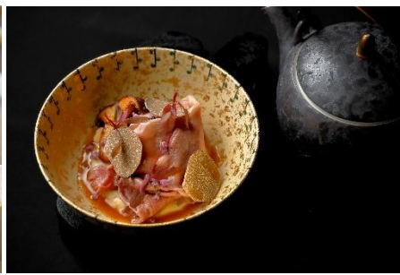
シェフズテーブル 「NIKUJAGA 牛リブロース 大黒本しめじ」