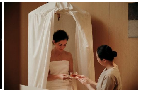
温活スパプラン「THE ROKU SPA ハーバルスチーム&トリートメント」