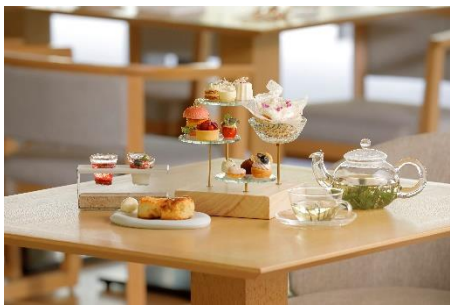
アフタヌーンティー -kitayama sugi-