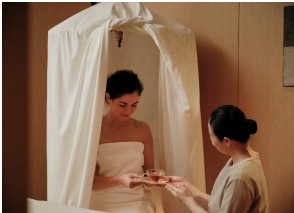
ナチュラルハーバルスチーム イメージ

冷えからくる血行不良や寒さで縮こまった身体をほぐすべく、2023年の冬は「温活」をキーワードに、季節のハーブを用いたハーバルスチームとボディトリートメントを組み合わせた「THE ROKU SPA ハーバルスチーム&トリートメント」を販売いたします。ハーバルスチームは、別名「よもぎ蒸し」ともいわれ、漢方薬の蒸気を身体に当てて皮膚や粘膜から薬効成分を吸収させ、発汗とともに老廃物を排出、体温の上昇により基礎代謝を上げるのが特徴です。THE ROKU SPA では、国産のヨモギやユーカリ、ミカンの皮のほか、黒文字やエストラゴン、ダイウイキョウなど数種類のハーブを組み合わせた蒸気をゆっくりと身体の下から当てていきます。ハーブの香りに包まれた後、オリジナルアロマブレンドオイルを使用したボディトリートメントで、温まった身体をさらにほぐしていきます。トリートメント終了後には、身体と心を緩めるホットジンジャーティーをご用意。トリートメント全体を通じて身体を芯から温めていただき、保温と発汗により新陳代謝を高めることで、身体の不調改善を目指します。ホテルSPAで体験するハーバルスチームで、至福のリラックスタイムをお過ごしください。