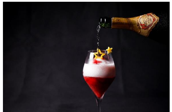
クリスマスカクテル「フレーズノエル」

クリスマスホリデーの3日間限定でご提供する「フレーズノエル」は、たっぷりのフレッシュ苺にカシスリキュールを合わせ、シナモンの風味をプラスしたブランデーベースのフローズンカクテル。仕上げに、エレガントな味わいのシャンパン「デュモアゼル テート・ド・キュヴェ」を注いで完成する一杯です。甘酸っぱい苺の華やかな香りとシャンパンの芳醇なアロマとが調和し、ホリデームードをより一層盛り上げます。水盤に面した幻想的な空間のザバーにて、優雅なひとときをお過ごしください。