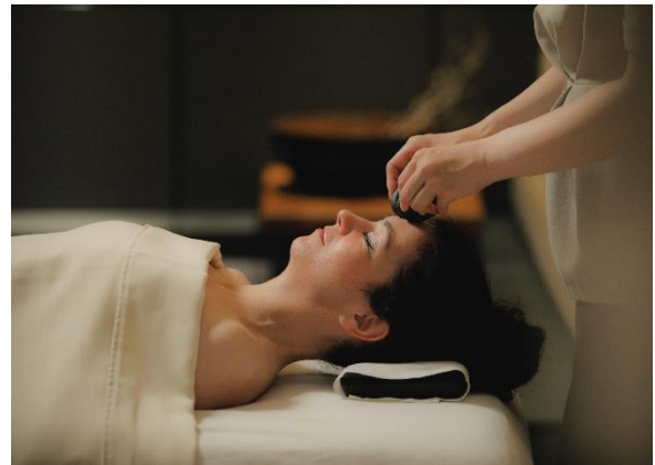
ホットストーン ヘッドヒーリング