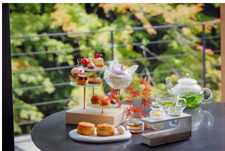
アフタヌーンティー -kitayama sugi-

秋の「収穫」をテーマにしたアフタヌーンティーの提供 安眠へと誘うホットストーンヘッドトリートメントの販売 旅の思い出を「京色パステル」で描く芸術の秋にちなんだ宿泊プランの販売