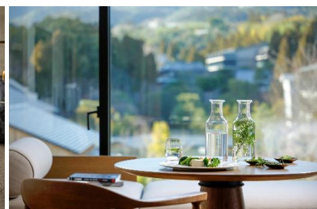
THE ROKU SPA ファスティングプラン