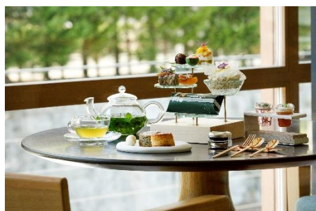
アフタヌーンティー -kitayama sugi-

京都の伝統野菜や果物を取り入れた地産地消の夏アフタヌーンティーの提供 4種の和素材コンディメントで楽しむミルク宇治抹茶シェイプアイスが登場 心と身体を整える2泊3日のTHE ROKU SPA ファスティングプランの販売