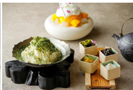
「夏 麓 氷 (なつ ろく ごおり)」