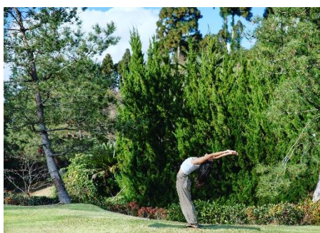
瞑想&リラクゼーションヨガ