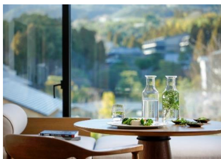
THE ROKU SPA ファスティングプラン