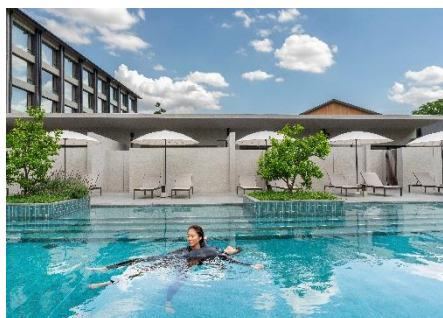
サーマルフローティング