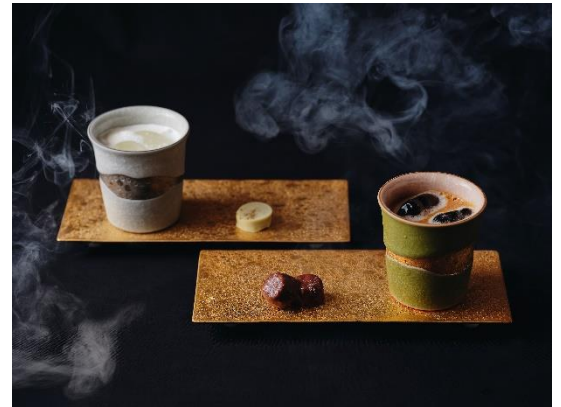
右「トネール・ショコラ」 左「ヴァン・ショコラ」

琳派を代表する作品「風神雷神図屏風」をモチーフにしたチョコレートカクテル 2 種をご提供いたします。濃厚な甘味のホワイトチョコレートで雷神をイメージした「トネール・ショコラ」、コク深い苦味が効いたダークチョコレートで風神をイメージした「ヴァン・ショコラ」と、2 杯で1つの作品が完成する“二曲一双”のオリジナルカクテルです。稀代のマルチアーティスト・本阿弥光悦が芸術村を築き、琳派発祥の地ともされる鷹峯に位置する ROKU KYOTO ならではのカクテルをお楽しみください。