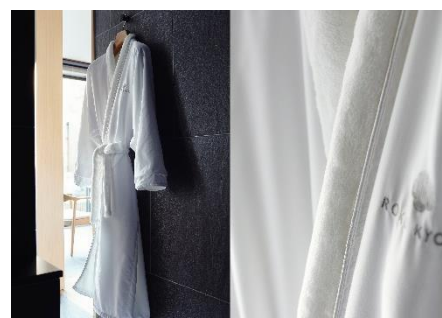
ROKU KYOTO オリジナルバスローブ