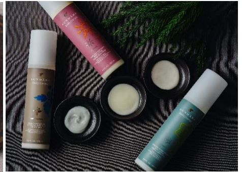
SPA「ウインターモイスチャライズ」

レストラン「TENJIN」では、雪化粧をした鷹峯の自然をテーマに、ホワイトを基調とした煌びやかなスイーツやセイボリーが並ぶ「アフタヌーンティー -kitayama sugi-」をご提供いたします。柚子や檸檬、金木犀の香るスイーツや、帆立貝やズワイ蟹など冬の味覚を取り入れたセイボリーなど、丁寧に仕立てられた品々が北山杉をイメージしたティースタンドを煌びやかに白く染め上げます。