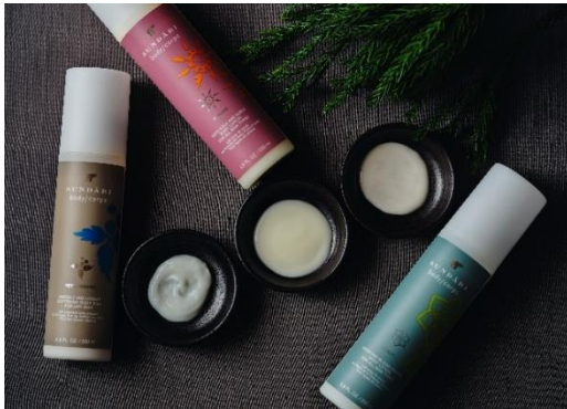
SUNDĀRI ボディローション&ミルク

ニューヨーク生まれのスキンケアブランド「SUNDĀRI」のフェイシャルトリートメントに、ボディローションまたはミルクで全身を保湿するボディケアが付いたこの冬だけの限定パッケージをご提供いたします。ニームやゴツコラといったオーガニック植物成分を取り入れたフェイシャルトリートメントでは、なりたにお肌に合わせて2コースをご用意いたしました。ボディケアでは、トリートメント前に行うドーシャチェックにより、ご自身の体調や状態、好みに合わせた香りと成分のボディローションまたはミルクをお選びいただき、身体を温めながら全身を保湿のヴェールで包み込みます。保湿効果に加え、軽擦による血行促進も期待でき、潤いに満ちた柔らかなお肌へと導きます。乾燥が気になる冬の季節に、フェイシャルとボディのトータルケアで心身ともに癒されるひとときをお過ごしください。