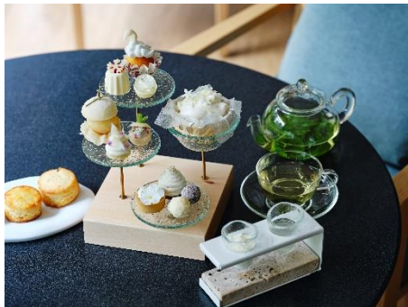
アフタヌーンティー -kitayama sugi-