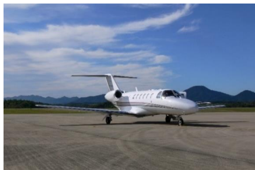
プライベートジェット イメージ

1月1日の早朝にプライベートジェットで出発し、上空から初日の出を眺めるツアーが付いた宿泊プランを1グループ限定で販売いたします。初日の出フライトでは、約2時間の遊覧飛行にて富士山や三重県伊勢神宮などを周遊し、プライベートな空の旅をお楽しみいただけます。機内に用意したこだわりのシャンパンを片手に、優雅に初日の出を迎えていただけます。空気の澄んだ朝、新しい気持ちで迎える1年の始まりをご家族やご友人同士、大切な方と一緒に過ごしてください。