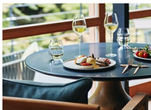
朝食 ロクブレイクファスト