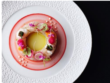
クリスマスメニュー