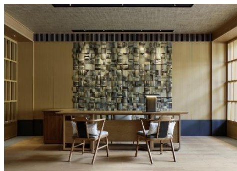
THE ROKU SPA