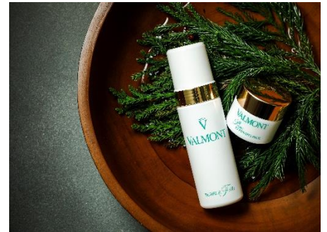
Exclusive ROKU VALMONT Facial

2022 年のクリスマスケーキは、サンタクロースをモチーフにした艶やかなムースケーキ「Père Noël (ペール ノエル)」と、雪の降り積もったもみの木をイメージした純白のストロベリーショートケーキ「Sapin de Noël (サパン デュ ノエル)」の 2 種類をご用意いたしました。12 月 24 日(土)、25 日(日)の各日それぞれ 10 個限定での販売で、ご予約開始は 2022 年 11 月 1 日(火)より開始いたします。