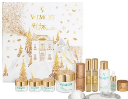
Valmont クリスマス アドベントカレンダー2022

自然に溶け込む癒しの「THE ROKU SPA」では、Valmont が ROKU KYOTO のためだけに考案したオリジナルのフェイシャルトリートメントと、数量限定発売の Valmont 「クリスマス アドベントカレンダー2022」をセットにしたプランを 3 名様限定で販売いたします。ヴァルモン独自のバタフライムーヴメントによる 3 つのマッサージにより、潤いを与え、滑らかで輝きに満ちた気品ある肌へと導くフェイシャルトリートメント「Exclusive ROKU VALMONT Facial」をご体験いただきます。ご自宅に帰った後は、Valmont のクリスマスコフレで叶えるおこもり美容で、じっくりとスキンケアをお楽しみいただけます。待ちに待ったフェスティブシーズン、自分へのご褒美スパとして、スイスの美しい自然環境から生まれた Valmont に満たされるひと時をご堪能ください。