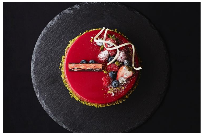
クリスマスケーキ

また、年末年始のホリデーシーズンには限定の宿泊プランをご用意。プライベートジェットから初日の出を眺める「迎春プラン」や、カウントダウンパーティーを含む「カウントダウンプラン」など、「ROKU KYOTO」でしか体験できない上質な時間をご提供いたします。各種宿泊プランは、2021年10月11日（月）より電話（075-320-0116）またはメール（ roomreservation@rokukyoto.com ）にて予約を開始いたします。