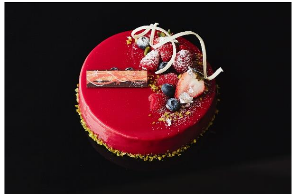
Rouge Noël（ルージュ ノエル） ¥5,400（税込）

銀世界をイメージした、純白な苺ショートケーキ。京都産の苺を使用し、生クリームは「クレーム・ソワニエ」を使用。