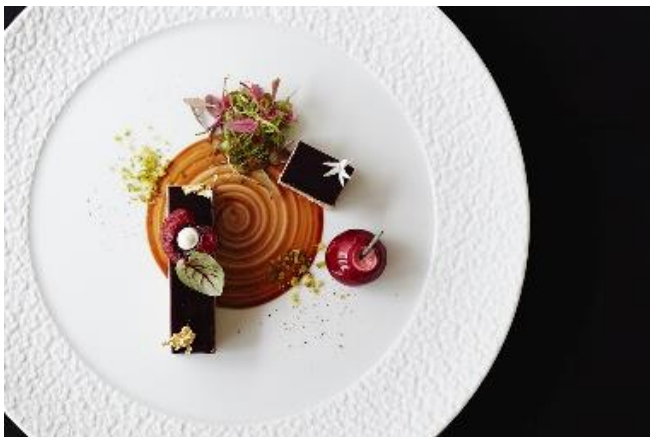
クリスマスメニュー

レストラン「TENJIN」公式HP URL： https://www.rokukyoto.com/restaurants/tenjin