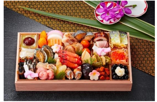
おせち料理（2名様分）

一年の締めくくりとなる年末を、自然に囲まれた「ROKU KYOTO」でゆったりと過ごす宿泊パッケージをご用意いたします。12月30日（木）から2泊のプランで、12月31日（金）の大晦日は宿泊者限定の「カウントダウンパーティー」へご招待。レストラン「TENJIN」で年越し蕎麦をお召し上がりいただいた後はミュージシャンによる演奏とともにカウントダウン。カナッペとともに楽しみいただけるドリンクやアルコールのフリーフローもご用意しております。翌、1月1日（土）のご朝食は、お部屋にておせち料理をご用意し、優雅な時間をお過ごしいただけます。予約は、10月11日（月）～11月12日（金）にて承ります。