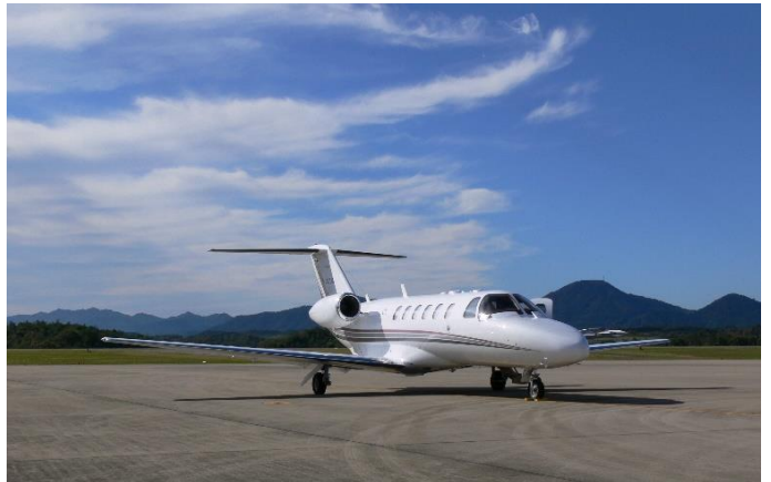
プライベートジェットイメージ