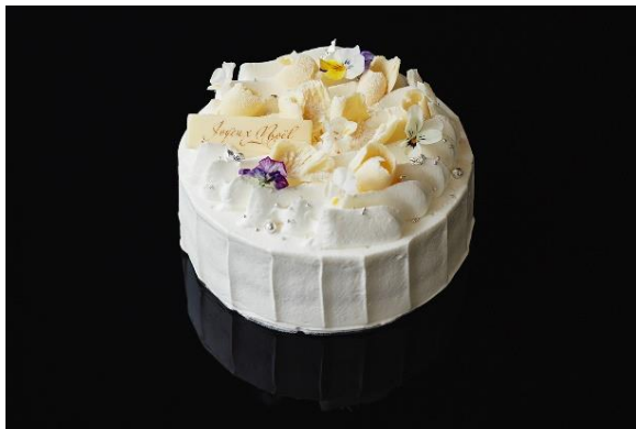
Monde d'Argent（モンド ダルジャン） ¥7,020（税込）

12月24日（金）、12月25日（土）に販売されるクリスマスケーキには、銀世界を重ねた純白な生クリームに京都産の苺をあしらった「Monde d'Argent（モンド ダルジャン）」と、フランボワーズとピスタチオのムースでクリスマスカラーをイメージした「Rouge Noël（ルージュ ノエル）」の2種をご用意。それぞれ1日10個の限定販売で、予約は11月1日（月）より開始いたします。